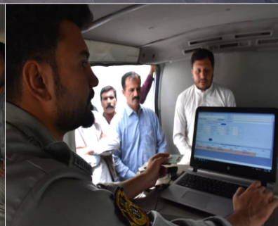
"Citizens are urged not to drive and to cooperate with Islamabad Traffic Police vehicles without driving licenses."